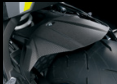
Carbon Kotflügel hinten 990D0-04K80-CRB Mattiert.