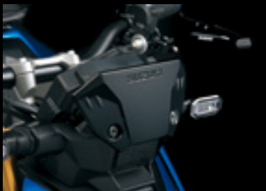
Windschild 51800-48810-000 Verbessert den Windschutz.