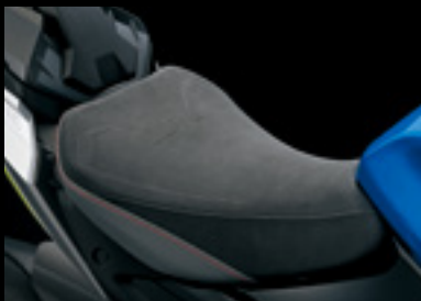
Stilvoller Fahrersitz 45100-48K50-B8P Einschließlich GSX-S-Logo.