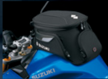
Tankrucksack groß* 990D0-04600-000 Strapazierfähiges Nylon, 11 l, erweiterbar auf 15 l. *Max. Geschwindigkeit 130 km/h, max. Zuladung: 2,5 kg