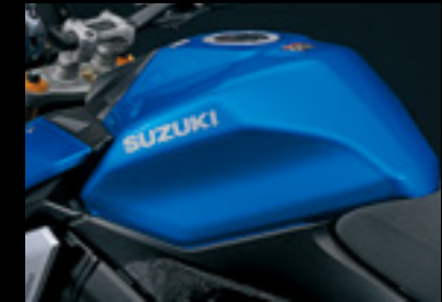
Tankschutzfolie transparent 99181-48K00-000 Schützt den Lack vor Kratzern.