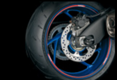
Felgendekor 990D0-WHL02-RD1 Rot/schwarzes Dekor mit Suzuki Logo.