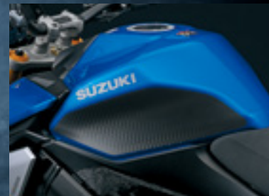
Tankschutzfolie schwarz 99181-48K10-BLK Folie mit neuem Design zum Schutz des Tanks.