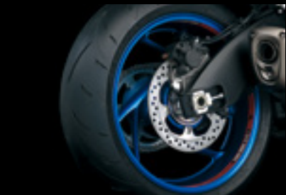
Felgenbettdekor 99182-48K10-RED Neues Felgenbettdekor mit GSX-S-Logo.