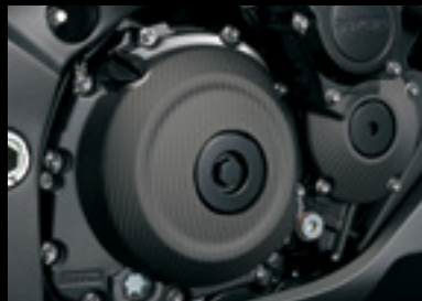
Carbon Kupplungsabdeckung 990D0-04K25-CRB Mattiert.