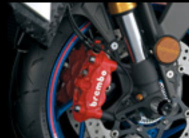
Brembo Bremssattel 59100-17800-000 Für rechts und links, Rot.