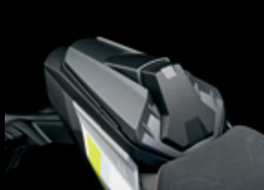
Soziusabdeckung 45500-48800-YKV Verbessert das sportliche Image.