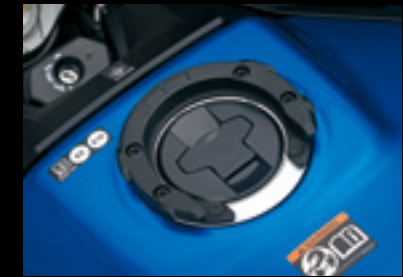
Ringbefestigung für Tankrucksack 99148-00A20-000 Zum Befestigen von Tankrucksäcken erforderlich.