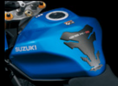
Tankpad 99180-48K20-BLK Zum Schutz des Tanks vor Kratzern, mit neuem GSX-S-Logo, schwarz.