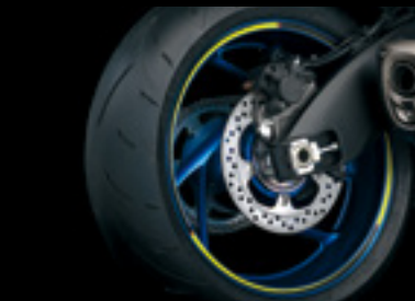
Felgendekor 99183-48K00-YEL Gelbes Dekor mit S-Logo.