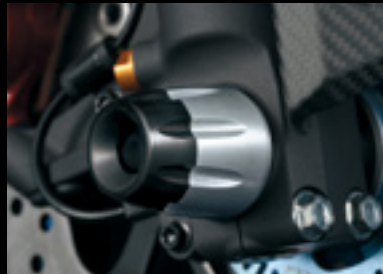
Achspannprotector Vorderrad 990D0-07L16-000 Aus Aluminium und Ertacetal.