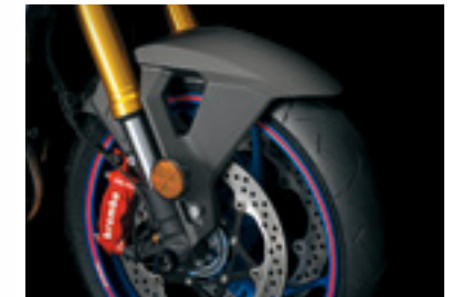
Carbon Kotflügel vorne