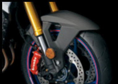
Carbon Kotflügel vorne 99130-48K00-CRB Mattiert.