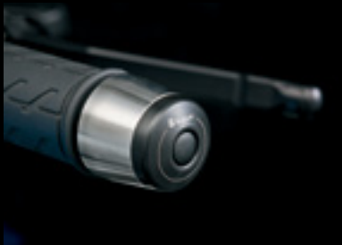
Lenkerenden-Gewichte 990D0-04K18-000 Aus Aluminium und Nylon, silberfarben mit schwarzem Kontrast und Suzuki Logo.