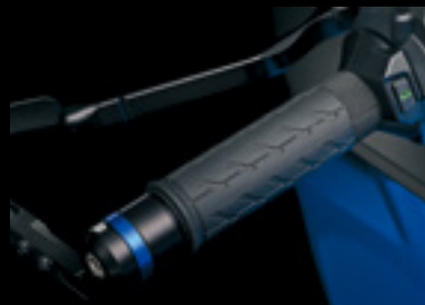
Griffheizung 57100-48821-000 Mit drei verschiedenen Heizstufen.