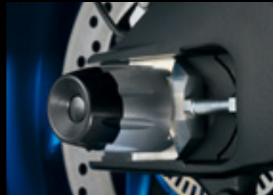
Achspannprotector Hinterrad 99116-48K00-000 Aus Aluminium und Ertacetal.