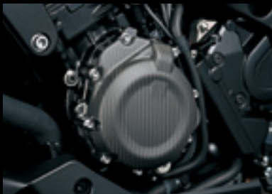
Carbon Lichtmaschinenabdeckung 990D0-04K20-CRB Mattiert.