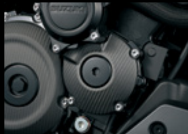
Carbon Anlasserabdeckung 990D0-04K26-CRB Mattiert.