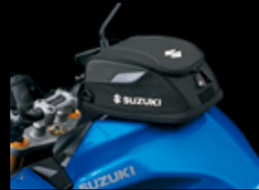
Tankrucksack klein* 990D0-04300-000 Strapazierfähiges Nylon, 5 l, erweiterbar auf 9 l. *Max. Geschwindigkeit 130 km/h, max. Zuladung: 2,5 kg