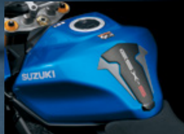
Tankpad 99180-48K10-GRY Zum Schutz des Tanks vor Kratzern, mit neuem GSX-S-Logo, grau/schwarz.