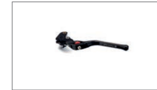
Billet Kupplungshebel B67-F3912-00-00