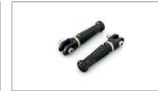
Custom-Fußrasten für den Fahrer 1WS-F2741-00-00