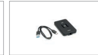
Drahtloses Lademodul YME-FWIRE-00-00