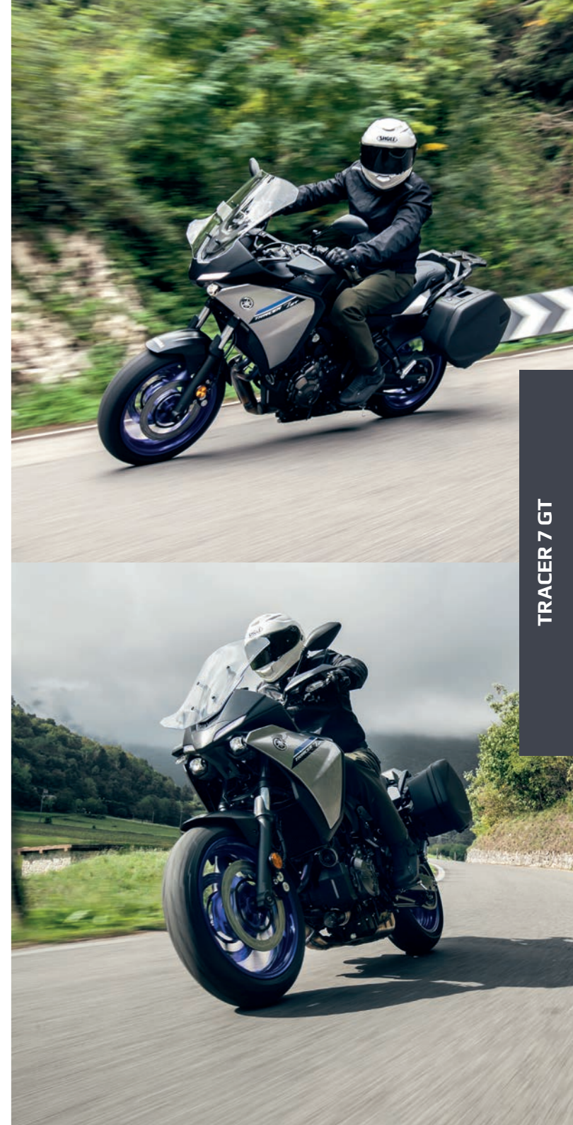
TRACER 7 GT