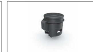
Verkleidung für Bremsflüssigkeitsbehälter B7N-FBFLC-00-00