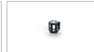
Schutzvorrichtung für den Bremsflüssigkeitsbehälter B5U-F8343-00-00