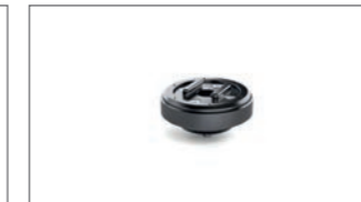
SP Connect™ Antivibrations-Modul YME-FAVM0-00-00