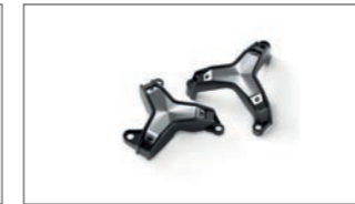
Side Slider-Satz B5U-211D0-00-00