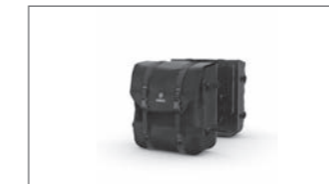
Explorer Softtaschen-Set B5U-FSSBH-00-00