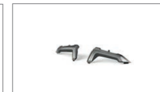
Reflektor in Rauchglasoptik BBW-F84SR-B0-00