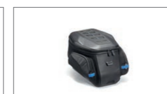
Tankrucksack Travel YME-FTBAG-TR-02