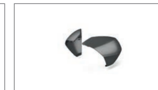
Set mit farbigen Topcase-Designelementen BBW-F84W1-A0-14