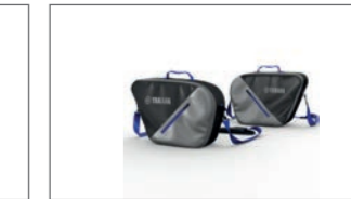
Innentaschen-Set für Seitenkoffer Tour und City B5U-FSCIB-00-00