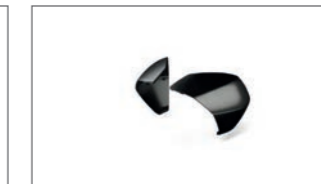
Set mit farbigen Topcase- Designelementen BBW-F84W1-A0-10