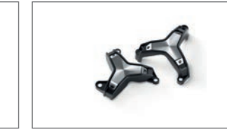
Side Slider-Satz B5U-211D0-00-00