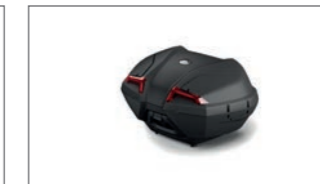
Topcase 45 L (Grundmodell) BBW-F840E-10-00