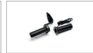
Heizgriffe „120“ YME-F2960-10-00