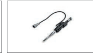
Quick Shifter-Set BAT-181A0-00-00