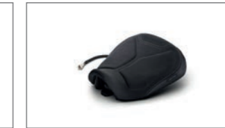
Beheizbarer Komfortsitz für TRACER 9 B5U-247C0-10-00