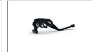
Handbremshebel schwarz B7N-RFFBL-00-00