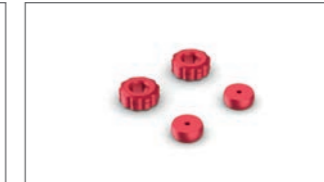
Farbakzente-Kit für Hebel YME-FCRLV-00-02