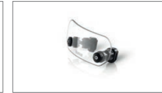
Ergänzung zur Verkleidungsscheibe (schmal) BW3-F83M0-00-00