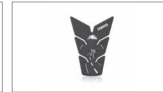
Road to Fuji Tankpad B4T-FTPAD-00-00