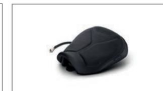
Beheizbarer Komfortsitz für TRACER 9 B5U-247C0-10-00