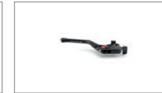
Gilles Handbremshebel 1RC-F3922-10-00