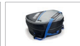
Innentasche für 45 L-Topcase YME-BAG45-00-00