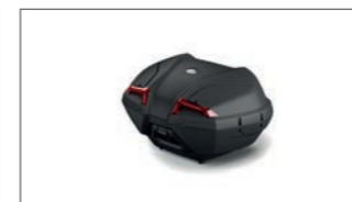
Topcase 45 L (Grundmodell) BBW-F840E-10-00