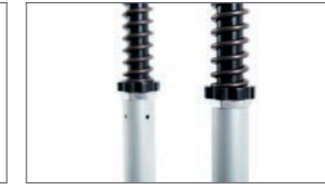
Öhlins-Kartuschensatz NIX 22 FKS-20400-00-00