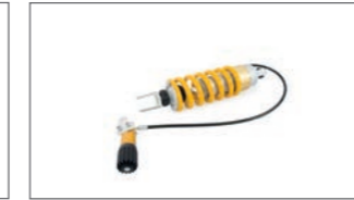
Stoßdämpfer hinten S46HR1C15 für TRACER 7 YA4-29000-00-00