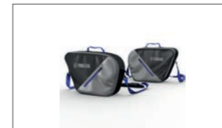
Innentaschen-Set für Seitenkoffer Tour und City BSU-FSCIB-00-00