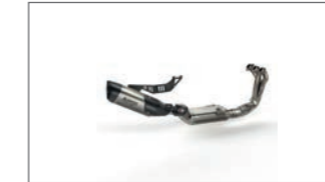
Akrapovič Komplettauspuffanlage 90798-32802-00