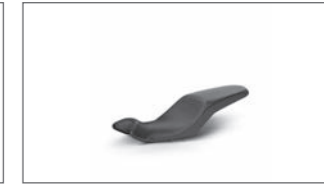
Niedrige Sitzbank B4T-F47C0-00-00