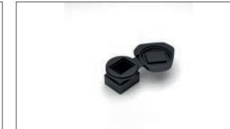
USB-Adapterhalter mit Kappe B4T-H7253-00-00