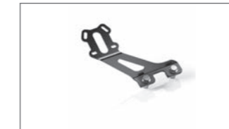
Halter zum Befestigen eines GPS- Gerätes an der Lenker-Querstrebe B4T-234A0-10-00