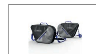
Innentaschen-Set für Seitenkoffer Tour und City B5U-FSCIB-00-00