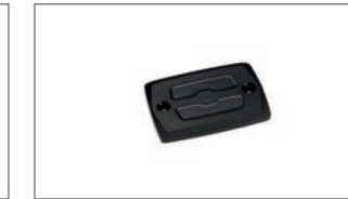
Billet-Bremsflüssigkeitsbehälter- Abdeckung B34-FBFLC-10-00