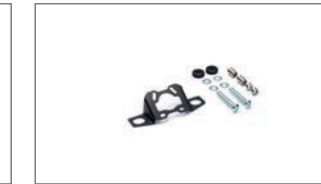
Halterung für GPS-Gerät BD5-F34A0-00-00