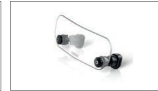
Breiter Zusatz-Windschild B3T-F83M0-00-00