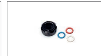
Abdeckung für hinteren Bremsflüssigkeitsbehälter B67-FBFLC-00-00