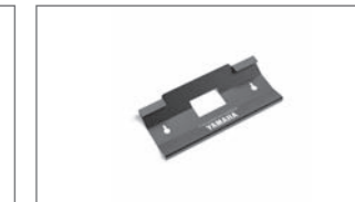
Wandmontage-Set für Seitenkoffer B5U-FSCWM-00-00