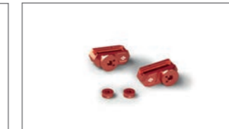
Farbakzent-Kit für Fußrasten- anlage B7N-FRSFN-00-02