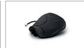
Beheizbarer Komfortsitz B5U-247C0-10-00