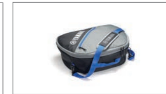
Innentasche für 45 L-Topcase YME-BAG45-00-00