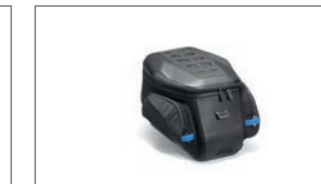
Tankrucksack Travel YME-FTBAG-TR-02

Die oben aufgeführten Artikel sind nur eine Auswahl der verfügbaren Anbauteile. Weitere Informationen erhältst Du bei deinem autorisierten Yamaha Partner. Dieser berät dich gerne, welche Produkte für deine Yamaha am besten geeignet sind. Eine vollständige Zubehörliste findest Du auch auf unserer Website.