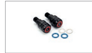
Billet Lenkerenden B67-FHBED-00-00