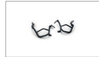
Explorer Motorschutz B5U-F43B0-00-00