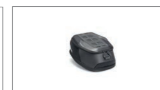
Tankrucksack Sport YME-FTBAG-SP-02