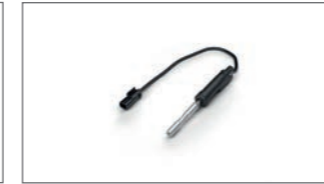
Quick Shifter-Set B5U-181A0-00-00