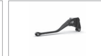
Kupplungshebel schwarz B7N-RFFCL-00-00