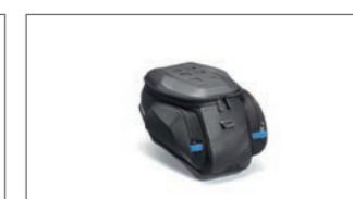
Tankrucksack Urban YME-FTBAG-CT-02