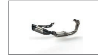
Akrapovič Komplettauspuffanlage 90798-32802-00