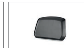
Soziusrückenlehne für das 45 L-Topcase BBW-F84U0-10-00

Die oben aufgeführten Artikel sind nur eine Auswahl der verfügbaren Anbauteile. Weitere Informationen erhältst Du bei deinem autorisierten Yamaha Partner. Dieser berät dich gerne, welche Produkte für deine Yamaha am besten geeignet sind. Eine vollständige Zubehörliste findest Du auch auf unserer Website.