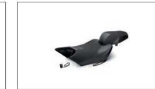
Beheizbarer Komfortsitz BD5-F47C0-A0-00