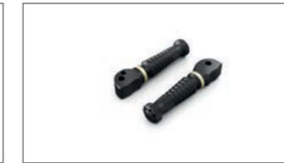
Custom-Fußrasten für Beifahrer 1WS-F2743-00-00