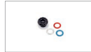
Alu Öleinfüllkappe 2PP-FE0LC-00-00