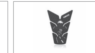
Road to Fuji Tankpad B4T-FTPAD-00-00