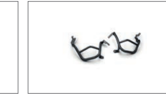
Explorer Motorschutz B5U-F43B0-00-00