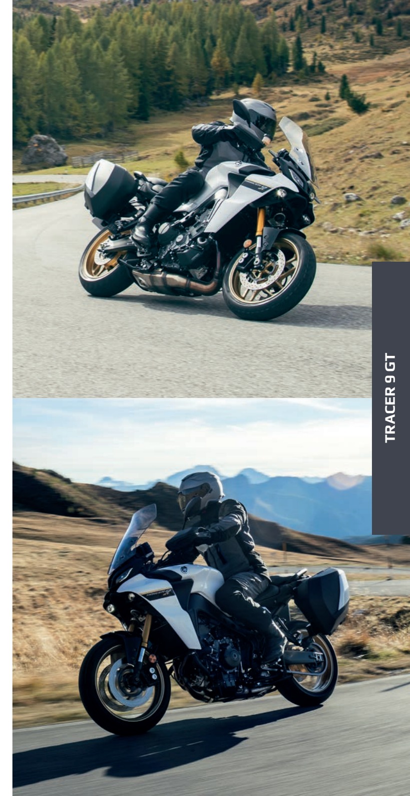
TRACER 9 GT