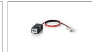
USB-Ladegerät 5V B4T-H6600-00-00