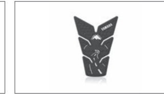
Road to Fuji Tankpad B4T-FTPAD-00-00