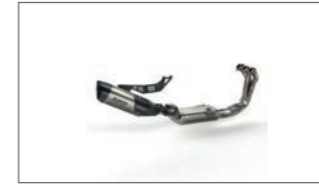
Akrapovič Komplettauspuffanlage 90798-32802-00