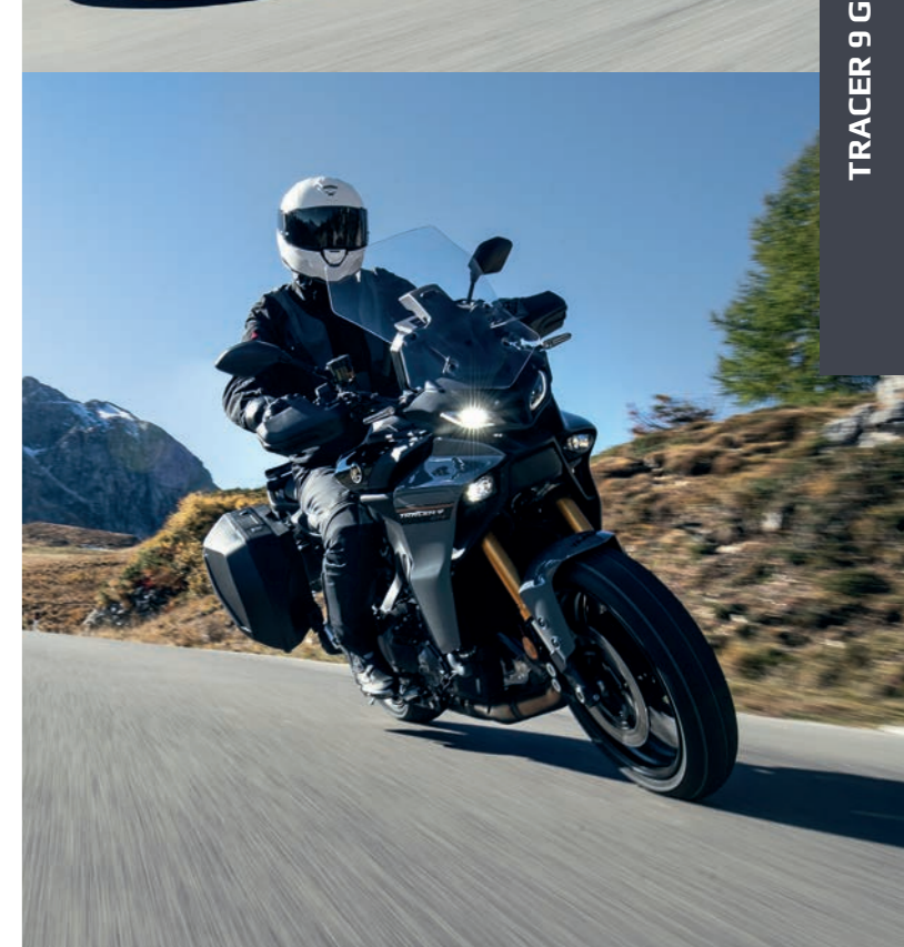
TRACER 9 GT+