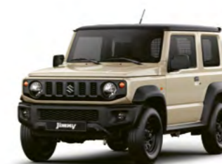
Chiffon Ivory Metallic/ Bluish Black Pearl Metallic