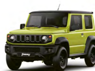
Kinetic Yellow/ Bluish Black Pearl Metallic

Gut möglich, dass Sie schon aus beruflichen Gründen gedecktere Farbtöne bevorzugen. Der Jimny bietet Ihnen dafür eine breite Auswahl. 2 der 6 Lackierungen sind außerdem mit schwarz abgesetztem Dach zu haben. Mit Kinetic Yellow zum Beispiel gibt das Ihrem Fahrzeug eine sehr expressive Note. An dieser Stelle lässt der Jimny mal alle „Nutzfahrzeug“-Vernunft phantasievoll hinter sich. Warum auch nicht.