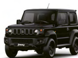
Bluish Black Pearl Metallic